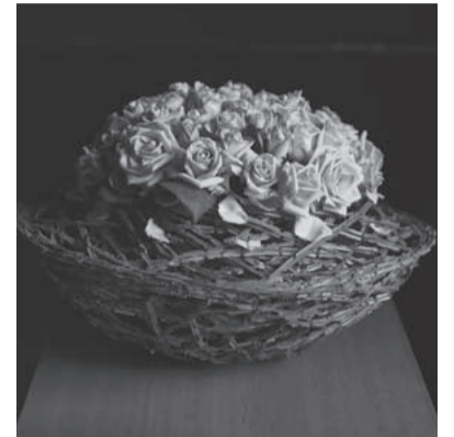
弥 March [3月] 生 使用花材/バラ(カオルローズ)、ニシギギ 作品制作年/2007年 ダニエル・オスト in 東寺 秋