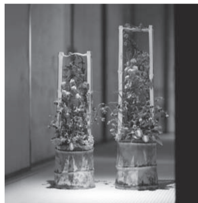
皐 May [5月] 月 使用花材/竹、利休草、黒百合 作品制作年/2009年 ダニエル・オスト in 金閣寺