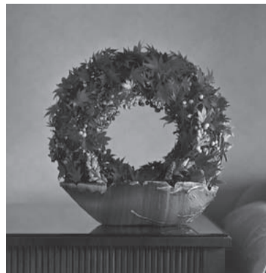
霜 November [11月] 月 使用花材/もみじ・野ぶどう 作品制作年/1997年 梅若能楽堂デモンストレーション