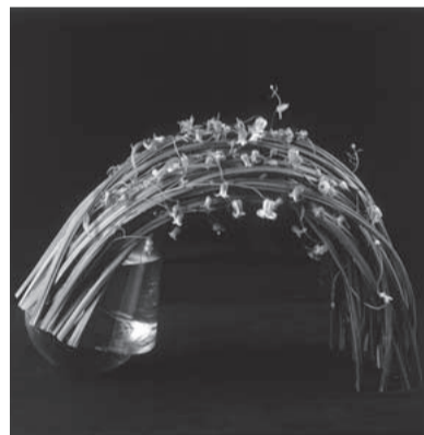
文 July [7月] 月 使用花材/クレマチス、スチールグラス 作品制作年/2008年 そごう 花の宇宙展