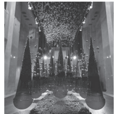
師 December [12月] 走 使用花材/りんご 作品制作年/2008年 帝国ホテルプラザ クリスマスデコレーション