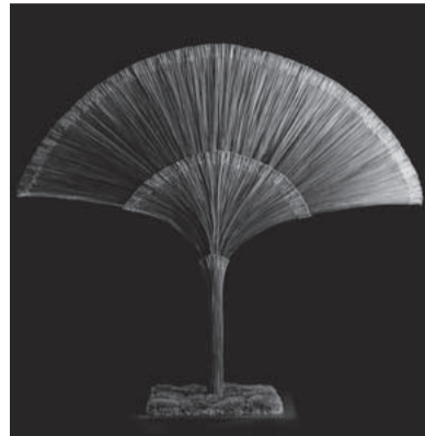
睦 January [1月] 月 使用花材/大王松 作品制作年/2010年 帝国ホテルのクリスマス

1955年ベルギー・アントワープ郊外に生まれる。ベルギー王室の装飾をはじめ、世界的な建築物を舞台に作品を発表、“花の建築家”と称される。数々の権威ある世界大会で賞を獲得し、これまでに出版した作品集が「世界で一番美しい本」展で銀賞を受賞するなど、その芸術性が絶賛されている。世界文化遺産の京都仁和寺、東寺の灌頂院で展覧会を開催し、日本の伝統美に調和した美しい造形と空間アートを展開した。近年では金閣寺のエキジビジョンが話題を呼んだ。上品で華麗、大胆さと繊細さを併せもつ独特の作風が観るものの心をとらえている。