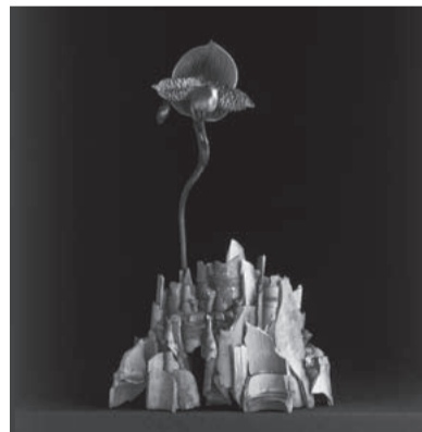
神 October [10月] 無 月 使用花材/ラン・竹炭 作品制作年/2007年 ダニエル・オスト in 東寺 秋