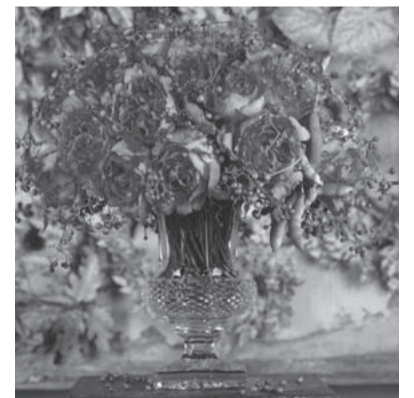
長 September [9月] 月 使用花材/バラ、野ぶどう 作品制作年/2007年 ベルギー セントニコラス