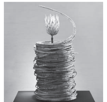
水 June [6月] 無 月 使用花材/黄金ミズキ、プロティア 作品制作年/2010年 クリスマスin帝国ホテル