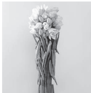
葉 August [8月] 月 使用花材/白蓮 作品制作年/2003年 B&Bイタリア