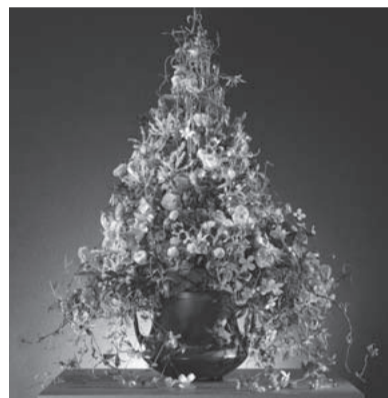
卯 April [4月] 月 使用花材/クレマチス、グロリオサ、利休草、 ランキユラス他 トルコキキョウ 作品制作年/2010年 池袋西武 花の宇宙展